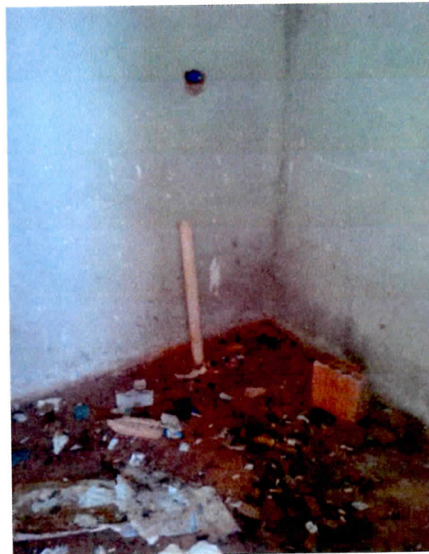
Figura 10 - Instalação Hidro-sanitária

CNPJ: 22.953.681/0001-45 / Av. Juscelino Kubitscheck, 02 - Centro, Dom Eliseu-PA. CEP: 68.633-000 / www.domeliseu.pa.gov.br / (94) 3335-2210