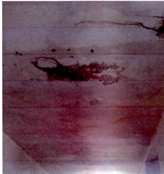
Figura 5 - Teto