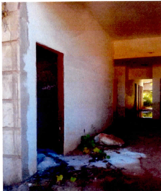
Figura 4 - Entrada / Recepção

CNPJ: 22.953.681/0001-45 / Av. Juscelino Kubitscheck, 02 - Centro, Dom Eliseu-PA. CEP: 68.633-000 / www.domeliseu.pa.gov.br / (94) 3335-2210