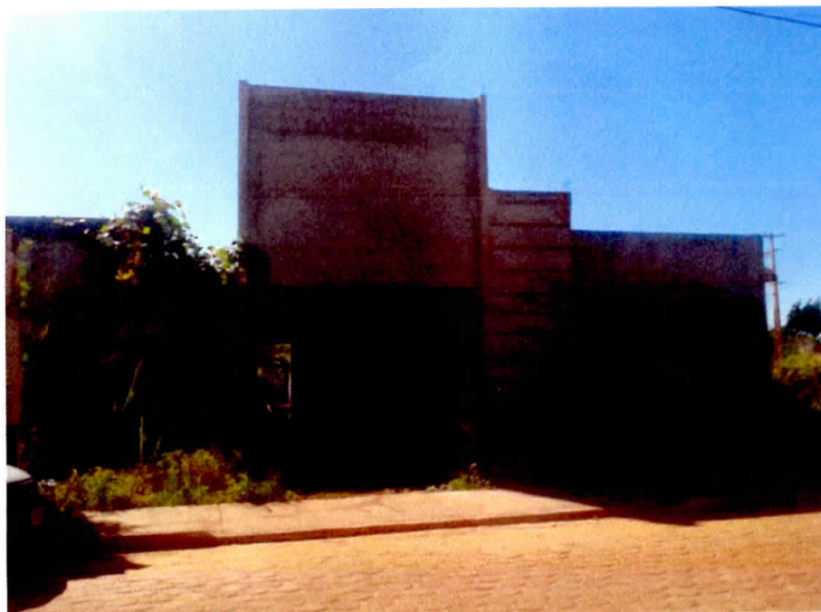
Figura 2 - Fachada

CNPJ: 22.953.681/0001-45 / Av. Juscelino Kubitschek, 02 - Centro, Dom Eliseu-PA. CEP: 68.633-000 / www.domeliseu.pa.gov.br / (94) 3335-2210