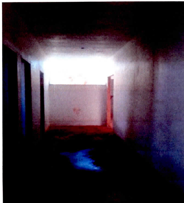
Figura 6 - Corredor de Acesso

CNPJ: 22.953.681/0001-45 / Av. Juscelino Kubitscheck, 02 - Centro, Dom Eliseu-PA. CEP: 68.633-000 / www.domeliseu.pa.gov.br / (94) 3335-2210