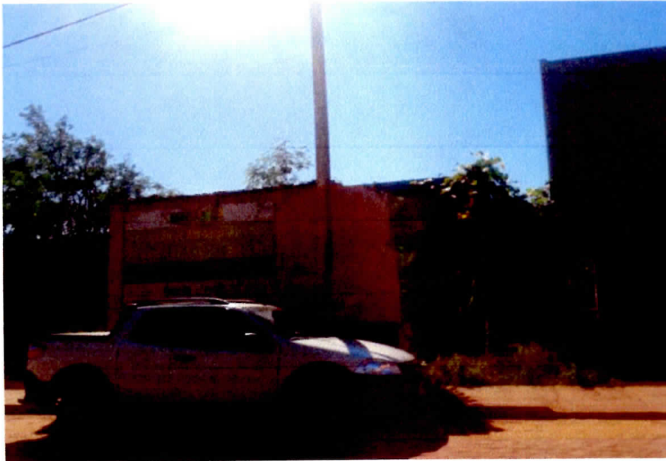
Figura 3 - Fachada com Placa da Obra