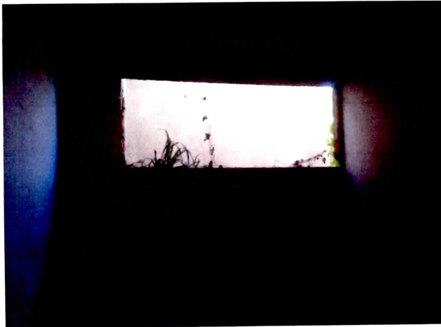
Figura 9 - Ambiente Interno