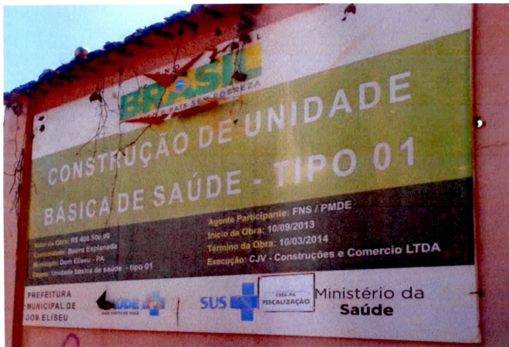
Figura 1 - Placa da Obra