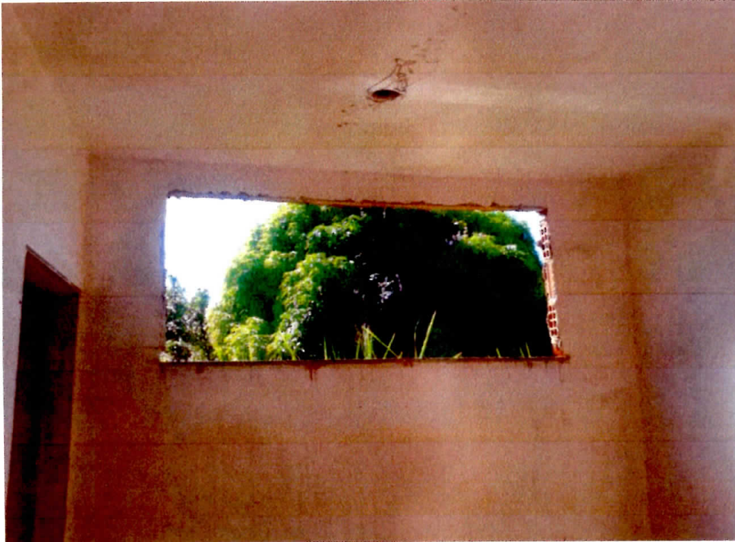
Figura 7 - Ambiente Interno