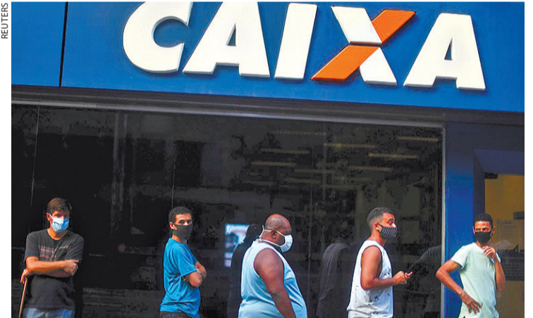
Milhares de trabalhadores vão todos os dias à Caixa em busca de informações

A Caixa orienta os trabalhadores a verificar o valor do saque e a data do crédito nos canais de atendimento eletrônico do banco: aplicativo FGTS e telefone 111. Caso o trabalhador tenha